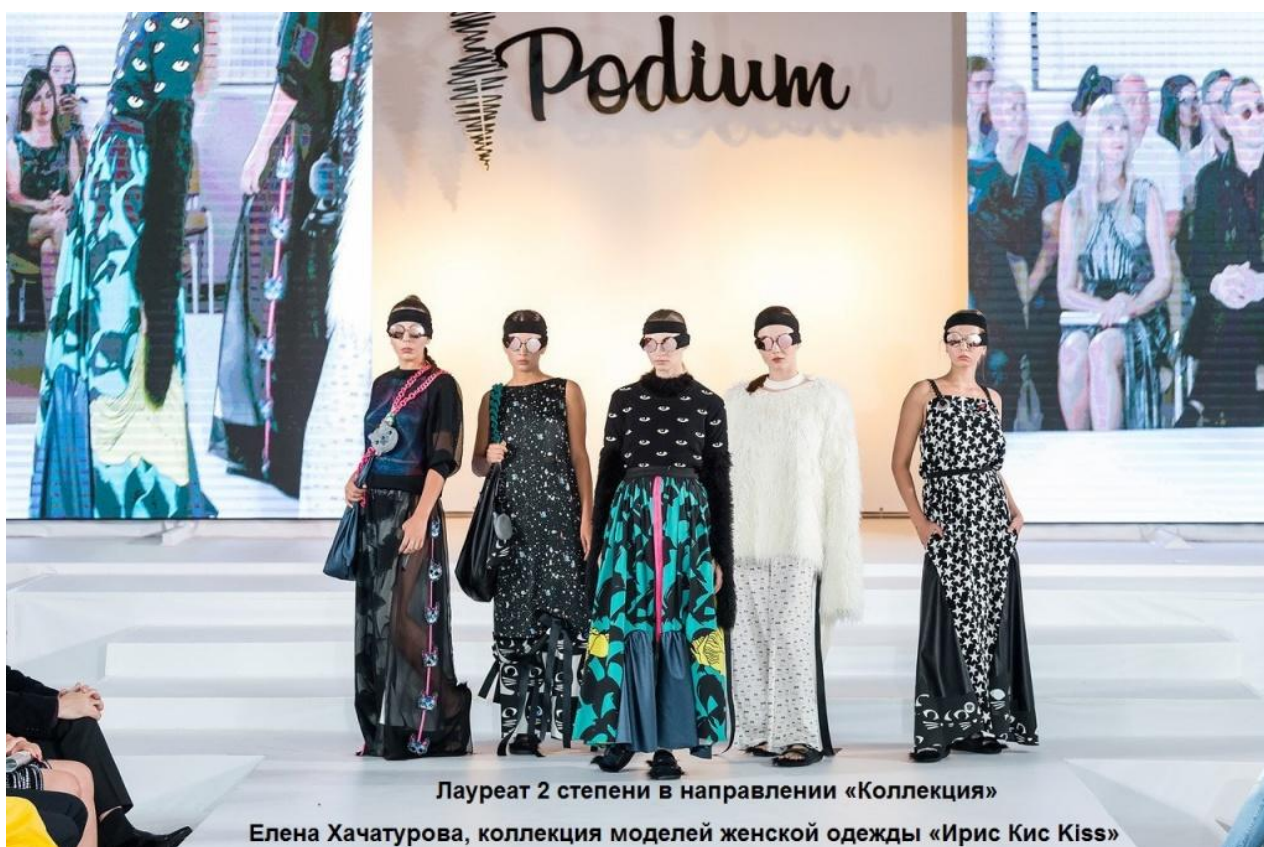
Лауреат 2 степени в направлении «Коллекция»